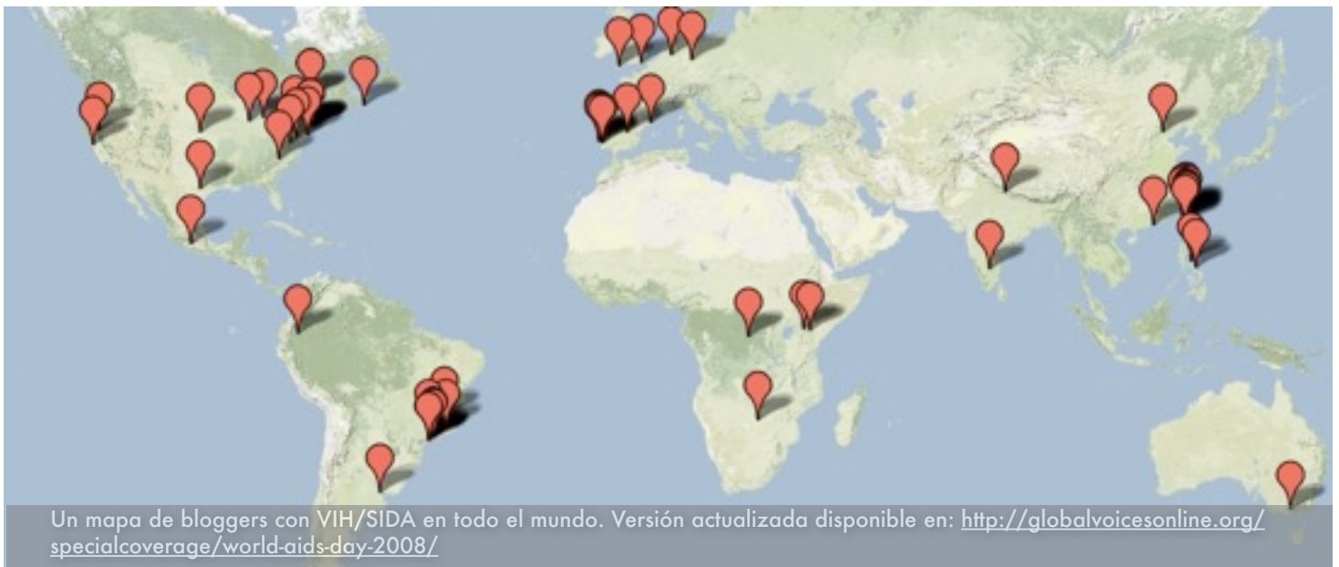
Un mapa de bloggers con VIH/SIDA en todo el mundo. Versión actualizada disponible en: http://globalvoicesonline.org/specialcoverage/world-aids-day-2008/

mundo, muchos de los cuales viven con sincrónicas, que con regularidad escriben de temas relativos VIH/SIDA. Nuestro mapa interactivo (enlace de abajo) enumera bloggers que hemos identificado, y siempre recibimos nombres adicionales de bien grado.